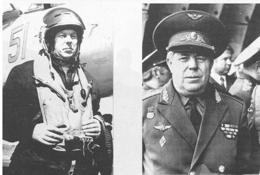
(Слева) 1968г. Аэродром «Бобровка». После полета на Су-9. (Справа) 1984г. Аэродром «Рось». Период освоения МиГ-29.