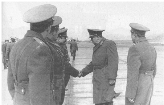
1981г. Петропавловск-Камчатский. Аэродром «Елизово».