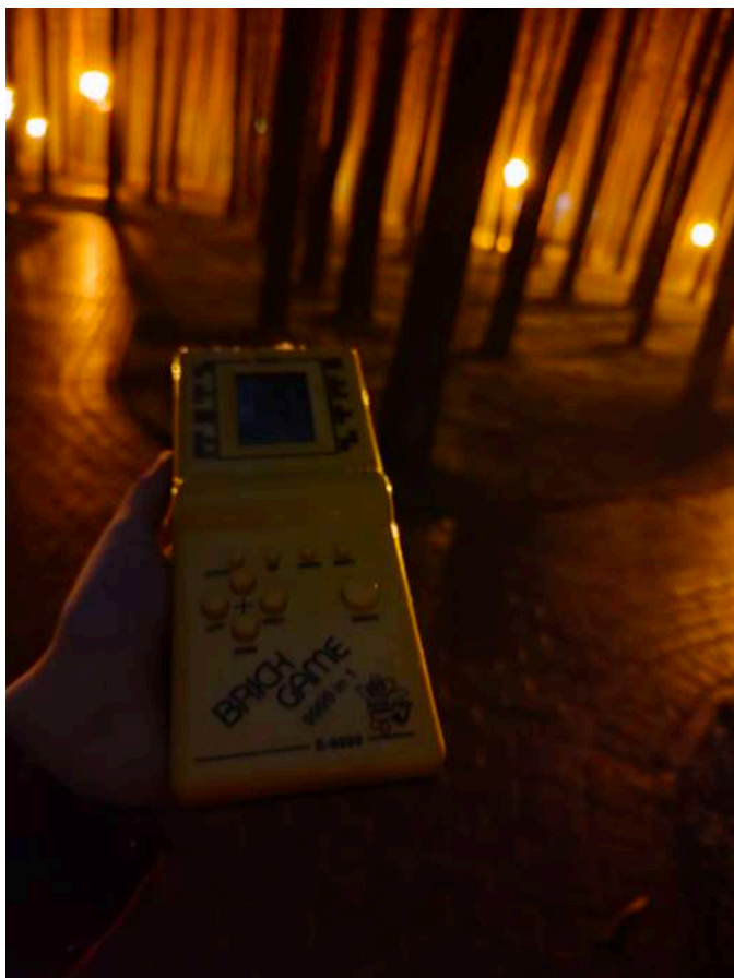
Нужно взять паузу Способ полюбить сургутскую осень